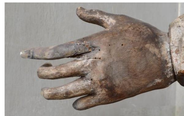
Detail řezby rukou.