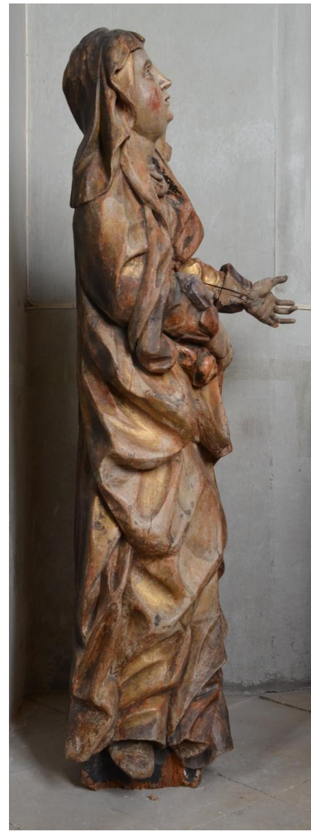
Plačící světice z kostela sv. Jakuba v Poličce.