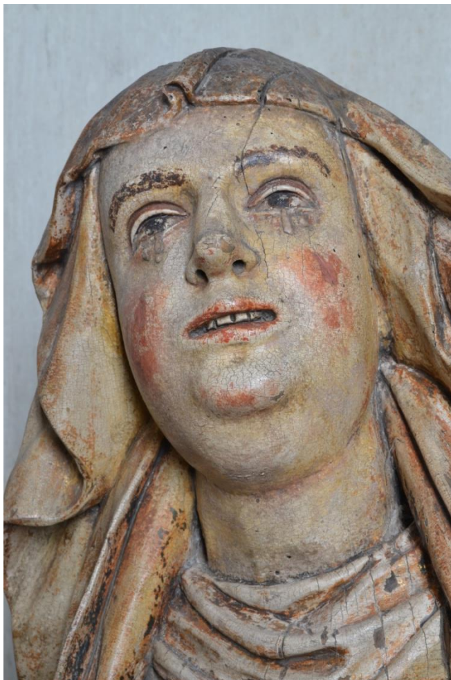
Tvář plačící světice.